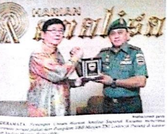
Generel... (Caption text describing the award ceremony)

Medan, (Analisa) Poldasu kembali mengidentifikasi tiga jenazah korban pesawat Hercules milik TNI AU yang jatuh di Jalan Dharma Gunung berbunga di Aceh. Satu jenazah sudah teridentifikasi sebagai jasad orang tua.