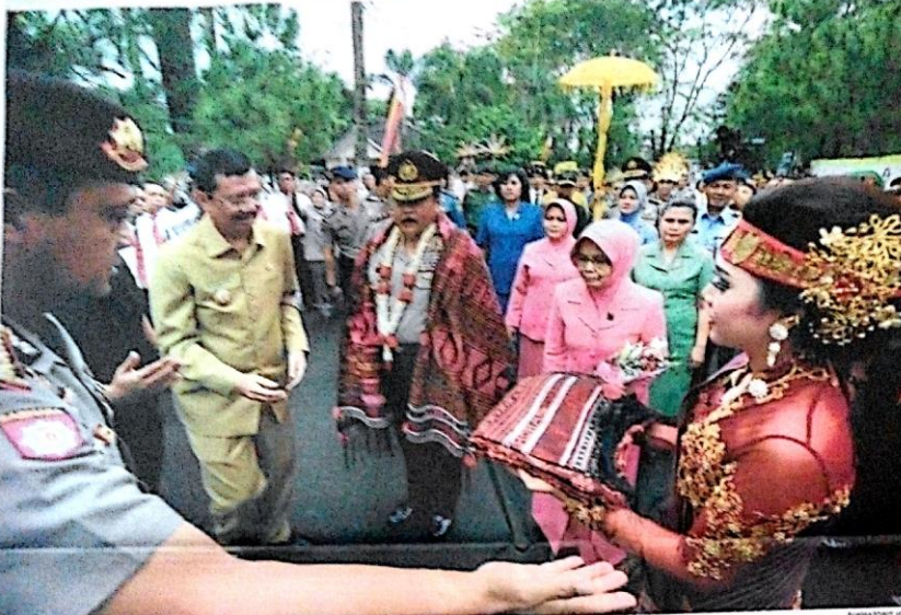
SAMBUTAN KEPALA... (Caption text describing the event in the photo)